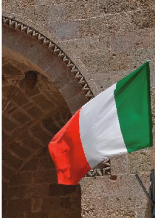
Torre dell'Orologio, piazza San Vincenzo