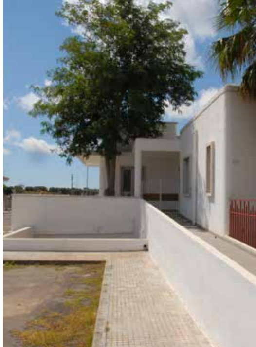
Il Centro ludico di prima infanzia in via Corfù

Carissimi concittadini, anche questa volta, pur con non poche difficoltà, siamo riusciti a garantire la pubblicazione di un nuovo numero del periodico istituzionale dell'Ente senza oneri a carico del Comune ma esclusivamente grazie alla generosa disponibilità di sponsor privati.