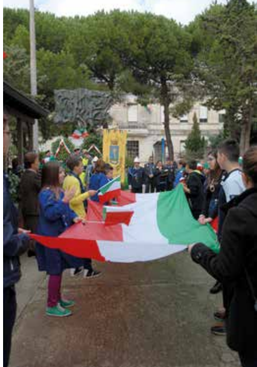
La bandiera dell'Italia portata dai ragazzi delle scuole durante le celebrazioni per il 4 Novembre

Carissimi concittadini, con enormi sacrifici siamo riusciti a garantire una nuova uscita del periodico istituzionale. Potrete verificare direttamente come l'attività amministrativa continui a essere svolta con grande determinazione in tutti i settori d'intervento.