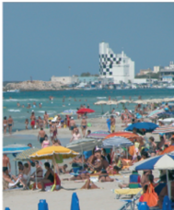
Libiola di Torre San Giovanni

Tedeschi, svizzeri, belgi, inglesi e, soprattutto, tanti italiani del Nord e del Sud: gli Uffici di Assistenza Turistica di Torre San Giovanni e di Ugento per il mese di agosto hanno avuto, rispettivamente, una media di 330 e 270 visitatori alla settimana. Seppur aperti con ritardo rispetto all'inizio della stagione estiva (l'ufficio di Torre San Giovanni ha iniziato a lavorare il 3 agosto, quello di Ugento il 28 luglio) i centri di assistenza turistica hanno svolto egregiamente il loro lavoro, fornendo utili informazioni ai turisti che hanno affollato la nostra città e le marine. Il "boom" delle presenze, come era prevedibile, si è avuto nella settimana dal 17 al 23 agosto, periodo nel quale l'ufficio di Ugento ha fornito assistenza a 326 turisti, mentre quello di Torre San Giovanni a 381. L'Ufficio di Ugento, lo ricordiamo, è stato allestito grazie ai fondi regionali del POR 2000/2006 (misura 4.16), che hanno permesso la ristrutturazione dell'immobile di piazza Adolfo Colosso in cui ha sede. L'allestimento degli uffici per la stagione estiva è stato possibile grazie al lavoro della Pro Loco Ugento e Marine: il Comune, con delibera di Giunta del 24 luglio 2009, ha riconosciuto all'associazione un contributo economico di € 4.000,00, utilizzato per la gestione dei servizi turistici presso gli IAT, i musei, il castello, la Cripta del Crocifisso e la chiesa della Madonna di Costantinopoli.