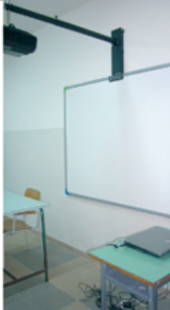
Lavagne interattive nella Scuola Media di Gornò

Grazie al progetto ministeriale "Innova Scuola", la scuola superiore di primo grado "Ignazio Silone" di Ugento ha avuto la possibilità di attrezzarsi di tre lavagne interattive, i nuovi supporti multimediali per l'insegnamento. Il progetto, svolto in collaborazione con altre sei scuole della provincia, ha curato la formazione dei docenti e l'acquisto del software necessari per mettere in funzione la strumentazione per la didattica innovativa. La lavagna interattiva, che andrà gradualmente a sostituire la vecchia lavagna di ardesia, è composta da un grande schermo a muro, un proiettore e un computer portatile collegato in rete. Sulla nuova lavagna è possibile scrivere, gestire immagini, riprodurre file video, consultare risorse web, conservare e archiviare tutti i contenuti delle lezioni in classe, inviarli e condividerli anche in tempo reale con altre scuole. Oltre ad un alto coinvolgimento degli alunni, che saranno facilitati nell'apprendimento grazie alle condivisioni di materiali e di linguaggi diversi, sarà più facile recuperare e scambiarsi materiali e percorsi didattici con gli studenti e con altri docenti. Le tre nuove lavagne, insieme ad altre tre finanziate da un ulteriore progetto e una acquistata con i fondi della scuola, costituiscono un notevole impianto tecnologico, che offrirà alla scuola media un ottimo punto di partenza per continuare ad innovare e migliorare l'offerta didattica.