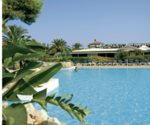
Il villaggio turistico Robinson Club Apulia