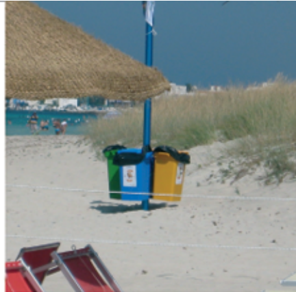
Mini isole ecologiche in spiaggia