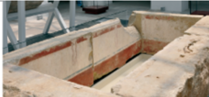
La tomba dell'Altieri, parzialmente restaurata