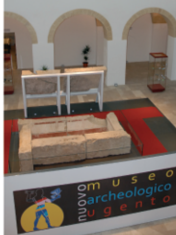
Aperto ritorno del Nuovo Museo Archeologico