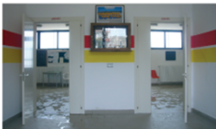
Campo sportivo e spogliatoi, via Taurisano